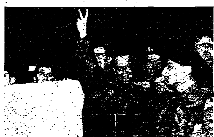
العمد عون يلوح للجماهير بعلامة النصر